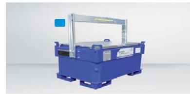
Taettava nostoaisa lisävarusteena 330-1000 L säiliöön HUOM ! Kaikki säiliömallit saa myös maalattuna