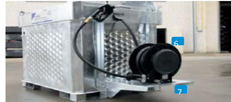
Letkukelman jalusta (no.97995) kuumasinkitty