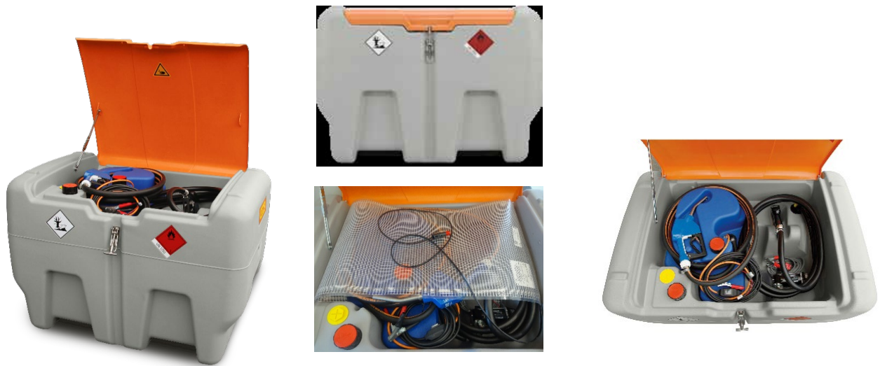
12V sähkölämmitysmatto pitää AdBlue tekniikan sulana

EI MÄÄRÄAIKAISTARKASTUSTA, EI KÄYTTÖIKÄ RAJOITUSTA ! MOLEMMAT NESTEET SAMAN KANNEN ALLA JA TARVITTAESSA LÄMMITETTYNÄ