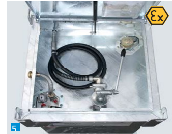
CONTY-B 330 TP-3 käsipumpulla